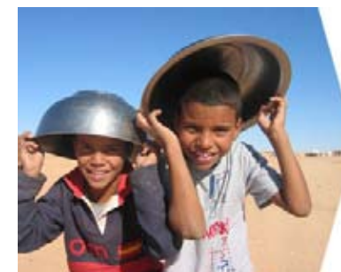
Sin título Fernando Medina Gascón 0764 - Área de Programación y Concert Asistencial

Plan de Emergencia El Plan de Emergencia posibilita una atención inmediata en situaciones de crisis humanitaria gracias a los convenios de colaboración establecidos con Bomberos Unidos sin Fronteras, Acción contra el Hambre, Médicos del Mundo y, como novedad en el 2008, Intermón Oxfam. Se ha intervenido, desde su creación, en más de 40 países en labores de rescate, salvamento y evacuación de personas, abastecimiento de agua y saneamiento, asistencia básica sanitaria, de nutrición, salud y seguridad alimentaria en las poblaciones damnificadas.